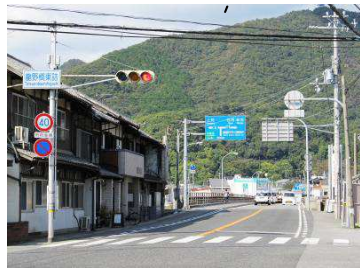
龍野橋をわたります。上映会はアポロスタチオで。