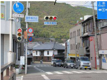
いよいよ川西地区です。ちょっとレトロな町中をご散策ください。