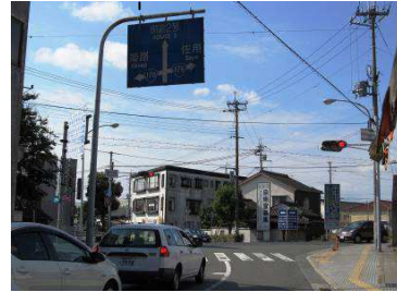
富永西交差点を右折します。