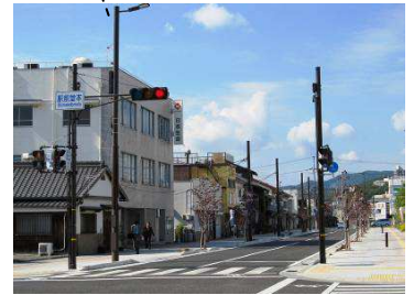
本竜野駅前を直進します。駅にも作品があるかも…。